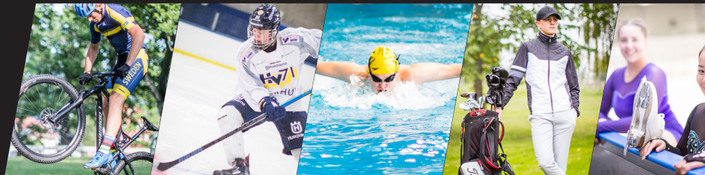
Mountainbike • Ishockey • Simsport • Golf • Konståkning