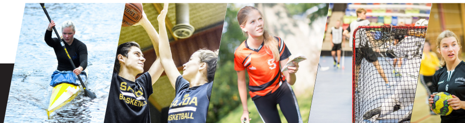
Kanot • Basket • Orientering • Innebandy • Handboll

Vi är en skola där digitalt lärande är en naturlig del i undervisningen. Vi erbjuder också ändamålsenliga undervisningslokaler för fysisk träning i vårt Träningsverk samt andra fina