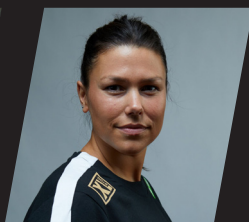
Filippa Idéhn Handboll